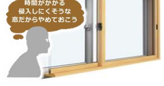
うち窓によってガラス破りがしにくくなります

二重窓になれば「ガラス破り」に手間がかかるため空き巣が侵入をあきらめる確率が高くなります。