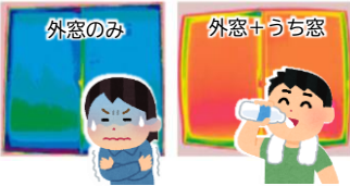
室内側の窓の表面温度も一目瞭然

室内に取り付けた「うち窓」と既存の窓との間の空気層が冷気を遮断し、高い断熱効果を発揮！