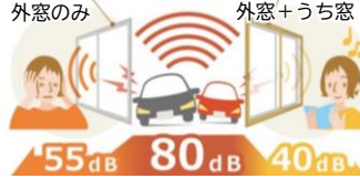
40dBは図書館並みの静かさ