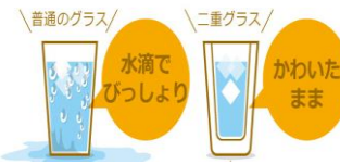
二重ガラスと同じで水滴が発生しにくい

今ある窓とうち窓の間の中間空気層で外気温の影響を受けにくくなり、結露を抑制します。