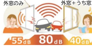
40dBは図書館並みの静かさ