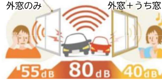
40dBは図書館並みの静かさ