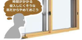
うち窓によってガラス破りがしにくくなります

二重窓になれば「ガラス破り」に手間がかかるため空き巣が侵入をあきらめる確率が高くなります。