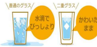
二重ガラスと同じで水滴が発生しにくい

今ある窓とうち窓の間の中間空気層で外気温の影響を受けにくくなり、結露を抑制します。